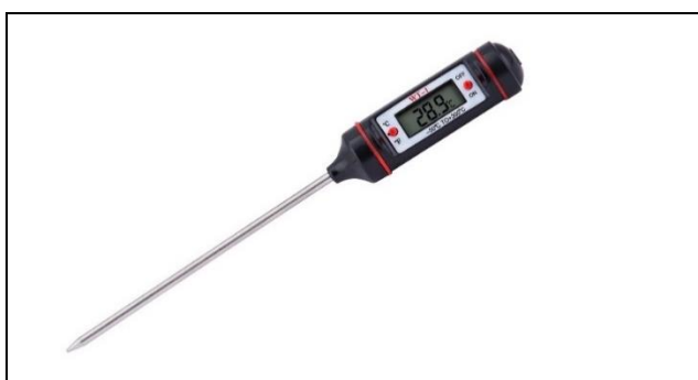
Термометр цифровой Артикул: 602210

Электронный термометр для серии «Добровар», «Добровар.Эконом» и «Добровар.Профи» позволяет с большой точностью контролировать температуру в процессе дистилляции и ректификации самогона и спирта. Удержание температуры в пределах 78°C–80°C позволит проводить процесс гораздо более эффективно: максимально отбирать спирт и оставлять ненужные фракции.